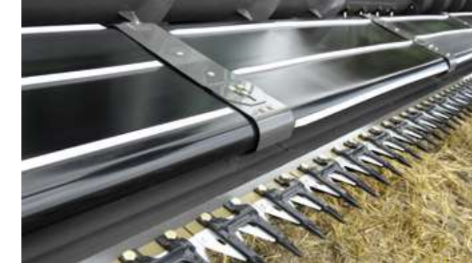
Tabla helezonu ile bıçak arasındaki 1,14 m.'lik mesafe, görüş kabiliyetinin ve performansın en yüksek düzeyde olmasını sağlar. Dayanıklı PowerFlow bantları, ürünleri bıçaktan alarak sabit bir hızla ana besleme boğazına yönlendirir. Bantlar ayrıca taşların makineye girmemesini sağlayarak hasara yol açmalarını engeller.

AutoLevel tabla kontrolü, kesim yüksekliği kontrolüyle beraber bir opsiyon olarak sunulmaktadır. Üstün kaliteli hidrolik ve elektronik sistemlerin birlikte çalışması sonucunda bir taraftan diğerine sağlanan pürüzsüz geçiş, sabit kesim yüksekliğinin hassaslıkla korunmasını sağlar.